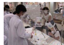
図3 コロナ禍で対応

3年連続でたまっころぼ単独で実験講座を開催した。今年度は新型コロナウイルス感染拡大という前例のない事例に対応しつつ、来場者に化学実験のおもしろさと学びの大切さを伝えることができた。化学薬品の取扱とコロナ対策の両立のため手作りフェイスシールドを考案した。(図3)