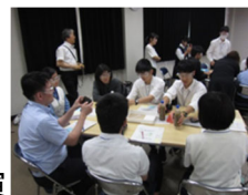
図4 ワークショップの進行役

2年連続で他校と共同開催した。自然環境をテーマとした講演やワークショップを企画した。同級生は勿論小学生から70歳を越える幅広い年齢層の方を相手に講演や進行役を務め市民講座を成功させた。(図4)