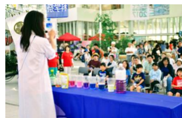
はこだて国際科学祭2017でのサイエンスショー

2013年に市民有志ボランティア「科学楽しみ隊」 1) に加わり、メンバーと共に小学校の行事や児童館などで子ども達に科学の楽しさを伝える活動を行なってきました。また、「はこだて国際科学祭」 2) への出展や運営サポート、科学イベントへの参加が困難な養護学校や支援学級に在籍する子ども達への出前講座にも積極的に取り組んでいます。