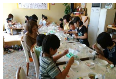
カフェでの親子実験教室

(1) 小学生親子向け実験教室として「スライムとぷよぷよボール 高分子の秘密」「プラスチックを科学しよう」「水性ペンのペーパークロマトグラフィー分析」「電池の仕組みを調べてみよう」「アルギン酸ボールのサイエンスドーム」「アントシアニンでカラフル実験」など。