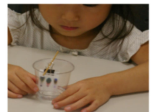
（図2 分析してみよう）

ことも学び化学分析が社会の中で重要な役割を果たしていることを学んでもらっている。『水と友達になろう』では、水を汚したり、また濁った水を高分子凝集剤で澄ませる実験を通じて、下水道の仕組みや水と環境の大切さを考えさせるような構成としている。